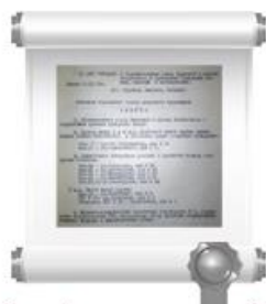
Копия фрагмента протокола №1 заседания Исполкома Новочебоксарского горсовета депутатов трудящихся, 8 января 1974 г.

Новочебоксарск по праву считается городом энергетиков. Чебоксарская ГЭС гидроэлектростанция, образующая Чебоксарское водохранилище, расположенная на реке Волге у города Новочебоксарска .