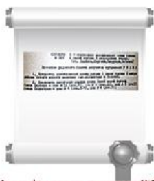
Копия фрагмента протокола №27 заседания Исполкома Новочебоксарского райсовета депутатов трудящихся, 28 декабря 1970 г.