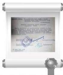
Копия фрагмента протокола №22 заседания Исполкома Чебоксарского горсовета с решением №213 о присвоении наименования улицы Винокурова, 17 июня 1965 г.