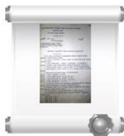
Копия Решения №418 Исполкома Новочебоксарского горсовета депутатов трудящихся, 1 декабря 1976 г.