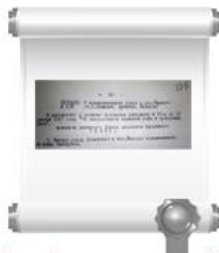
Копия фрагмента протокола №9 заседания Исполкома Новочебоксарского райсовета депутатов трудящихся, 14 мая 1968 г.

В дополнение к решению Исполкома райсовета № 27-и от 12 декабря 1967 г. «Об упорядочении названий улиц и нумерации домов» 14 мая 1968 г. в протоколе № 9 было записано: «Бывшую улицу Советская в пос. Иваново переименовать на улицу Заводская».