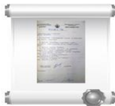
Копия постановления №132 городской администрации, 23 марта 1994 г.

В соответствии с рекомендациями комиссии по наименованию улиц, объектов соцкультбыта 23 марта 1994 г. было принято постановление № 132 Новочебоксарской городской администрации следующего содержания: «Присвоить наименование – улица Южная – дороге, проходящей по южной стороне VI и VII микрорайона Западного жилого района».