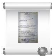
Копия решения №183 Исполкома Новочебоксарского горсовета народных депутатов, 17 августа 1988 г.

К 10-летию вывода войск из Афганистана на доме № 13 по улице Воинов-Интернационалистов были установлены две мраморные мемориальные плиты. На одной из них выгравированы имена четырнадцати погибших в Афганистане новочебоксарцев.