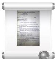
Копия Решения №418 Исполкома Новочебоксарского горсовета депутатов трудящихся, 1 декабря 1976 г.