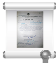
Копия решения №45 Исполкома Чебоксарского Горсовета о наименовании улицы Жени Крутовой, 30 января 1964 г.