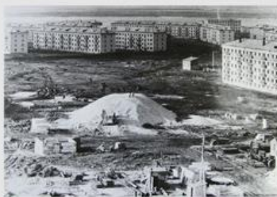
Строительство улицы Жени Крутовой, 1962 г.

В протоколе № 5 заседания Исполкома Чебоксарского горсовета от 30 января зарегистрировано решение № 45: «Присвоить улице, разделяющей первый и второй микрорайоны в городе Спутнике, имя героини-лётчицы 8-го женского Гвардейского авиационного полка Жени Крутовой, погибшей в годы Великой Отечественной войны и именовать впредь эту улицу улицей имени «Жени Крутовой».