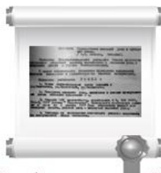
Копия фрагмента протокола №27 заседания Исполкома Новочебоксарского райсовета депутатов трудящихся, 12 декабря 1967 г.