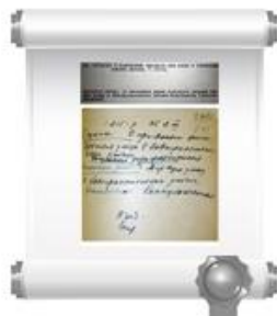
Копия фрагмента протокола №27 заседания Исполкома Чебоксарского Горсовета решением №215 о переименовании первой улицы г. Новочебоксарска, 12 июля 1962 г.