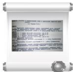
Копия фрагмента протокола №13 Исполкома Новочебоксарского горсовета депутатов трудящихся, 22 июля 1981 г.