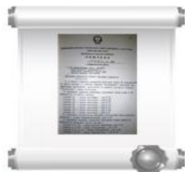
Копия фрагмента решения №162 Исполкома Новочебоксарского горсовета депутатов трудящихся, 17 апреля 1985 г.

«В связи с началом застройки восточной части IV микрорайона II жилого района и в районе совхоза «Ольдеевский» Исполком Новочебоксарского городского Совета народных депутатов 17 апреля 1985 г. решил «присвоить наименование автодороге, проходящей от нижнего кольца до совхоза «Ольдеевский», улица Восточная».