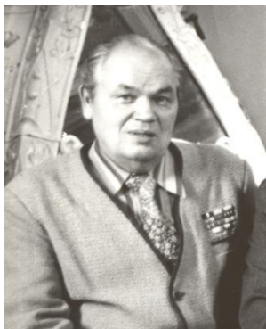
График. Художник по тканям. Член Союза художников СССР (1977).

Родился 15 апреля 1918 г. в д. Госкинеево, ныне в черте г. Новочебоксарска, в семье бедного крестьянина. Рано остался без родителей. Окончил семилетку в Цивильском детском доме (1925—1932), работал копировщиком в Чувашском книжном издательстве, занимался в студии у М. С. Спиридонова при Доме народного творчества (1932—1936), учился в Алатырском художественно-граверном училище (1938—1939); служба в